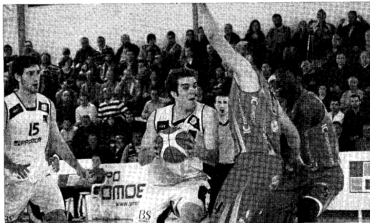
■ Los tijoleños rindieron al máximo y ganaron merecidamente.